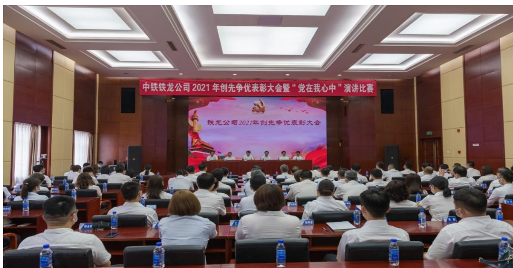
图 3.5 创先争优表彰大会

2021年，公司着力在党的政治建设上下功夫，正确引领公司发展方向。有效发挥党委“把方向、管大局、促落实”的领导作用，把学习习近平总书记最新重要讲话精神和对铁路工作重要指示批示精神作为党委会第一议题和党委中心组学习“首要内容”，把准公司发展的正确方向。聚焦公司年度工作，进行安全大检查，守住了安全底线；积极应对疫情，筑牢疫情防线；开展厉行节约教育，杜绝舌尖浪费，把“两个维护”落实到实际行动中。着力在党史学习教育上下功夫，激励党员守初心担使命。紧紧围绕习近平总书记系列讲话、党的十九届五中、六中全会精神、党史和“四史”学习材料，组织党员干部学习，不断强化学党史、悟思想、办实事、开新局的思想共识。组织党员到就近红色教育基地参观研学，精心组织开展征文、美术书法摄影展、知识竞赛、演讲比赛等庆祝中国共产党成立100周年系列活动。开展“我为群众办实事”实践活动。着力在固本强基上下功夫，夯实基层组织党内活动基础。公司所属9个全资、绝对控股子公司完成“党建入章”，把党的领导融入公司治理各环节。组建沙鲮分公司党委，7个党组织按期换届，评定15个“四强”党支部，举办3期党支部书记培训班，组织召开“七一”创先争优表彰大会（如图3.5），培训63名入党积极分子，发展25名新党员，走访慰问困难党员22人次。大力开展党内主题实践活动，围绕“两坚守两实现”、常态化疫情防控、抗洪抢险、破冰除雪等重点任务，指导基层单位成立突击队43支，义务奉献720人次，解决安全方面难题101件，服务方面难题178件，经营方面难题153件，让党旗始终在基层一线高高飘扬。