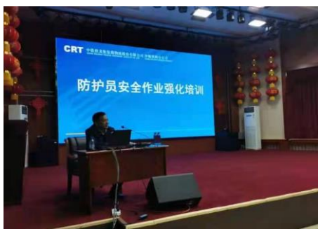
图 3.1 防护员安全作业强化培训

作为一线作业最复杂繁重的沙鲅铁路分公司，对员工的安全和技能培训方面一直秉持着严守规范纪律、一丝不苟、严肃认真、理论与实践相结合的优良传统，2021 年组织完成新职、转岗、晋升员工岗前规范化培训、职业技能鉴定考试考核、日常技术业务培训、防护员安全作业强化培训（如图 3.1）、全员劳动安全培训等常规化基础培训，以及汛期培训演练、消防培训演练（如图 3.2）等非正常情况下的应急演练，进一步提升了员工的业务水平和综合能力，保证生产安全，实现职教工作标准化、规范化。