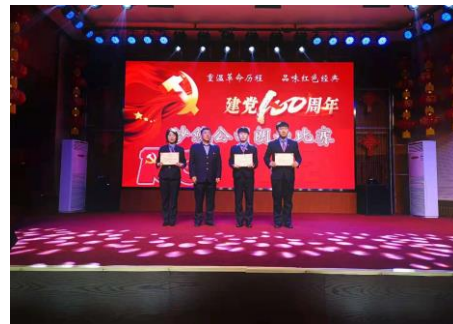
图 3.4 主题演讲比赛