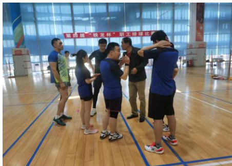
图 3.3 职工排球赛

为推动党史学习教育不断引向深入，引导全体党员进一步坚定理想信念、传承红色基因，公司党委先后举办了“学党史、知党情、跟党走”知识竞赛、“党在我心中”主题演讲比赛（如图 3.4）和征文活动、以及以书法、美术、摄影为主要内容的红色文化展览，激发广大干部职工“爱党、爱国、爱企、爱岗”的巨大热情，以积极向上的良好风貌向建党百年献礼。