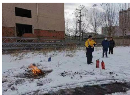
图 3.2 消防培训演练