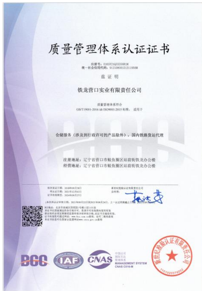
质量管理体系认证证书